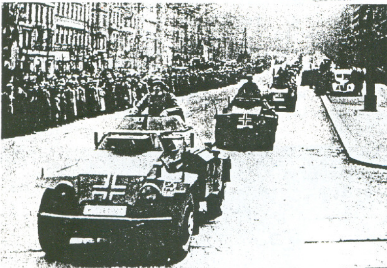
De bevolking van Praag kijkt in stille naar de Duitse militaire parade.